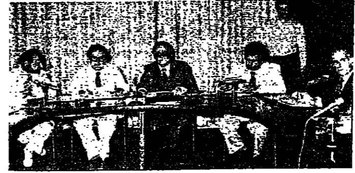
وزير العمل غسان تويني يصيحه من اليمين: جبريل خوري، حيد خوري، جو كيروز، الدكتور رضا وحيد

ترأس وزير العمل السيد غسان تويني امس، اجتماعا لمجلس ادارة صندوق الضمان، وبمشاركة وزير الوصاية، حيث بحث مع المجلس في انهاء الخلافات الحادة بين الاعضاء حول مشروع التسليف الاسكاني، الذي توقفت المناقشات حوله يوم الاثنين الماضي.